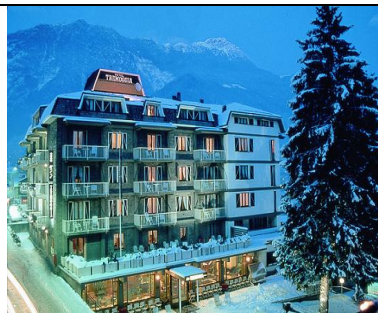
Hotel Tremoggia ****