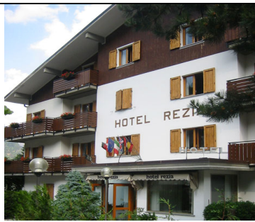
Hotel Rezia ***